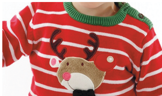
B. Stickad tröja med applikation av tygbitar