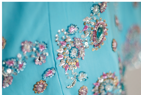
D. Kjol med paljetter.