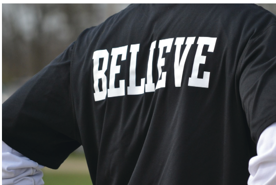
C. Tröja med plasttryck.